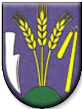
ERB obce Uňatín

Pečať Uňatína je okrúhla, uprostred s obecným symbolom a kruhopisom OBEC UŇATÍN.